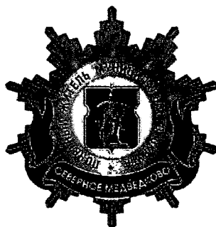
Рисунок нагрудного знака к званию «Почетный житель внутригородского муниципального образования – муниципального округа Северное Медведково в городе Москве»

Приложение 3 к решению Совета депутатов внутригородского муниципального образования – муниципального округа Северное Медведково в городе Москве от 14.02.2025 года № 2/1-СД